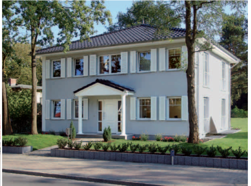
Musterhaus in Kleinmachnow