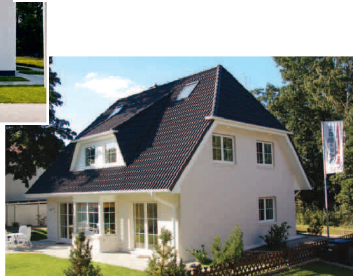
Musterhaus in Glienicke/Nordbahn