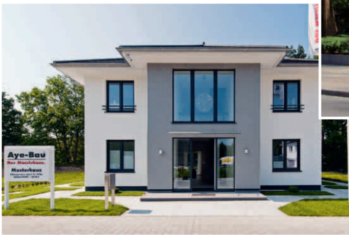
Musterhaus in Groß Glienicke