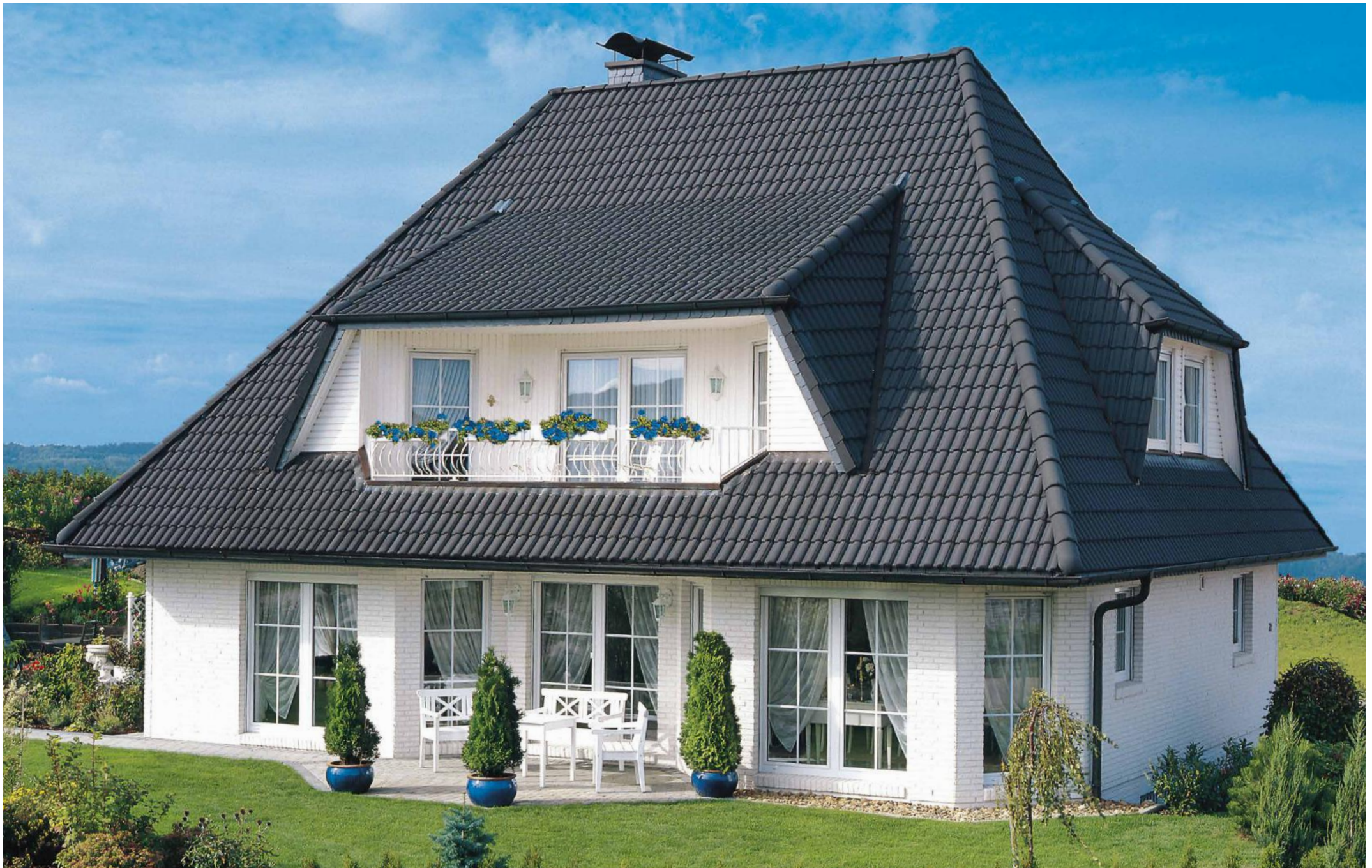
Abbildung enthält Sonderausstattungen