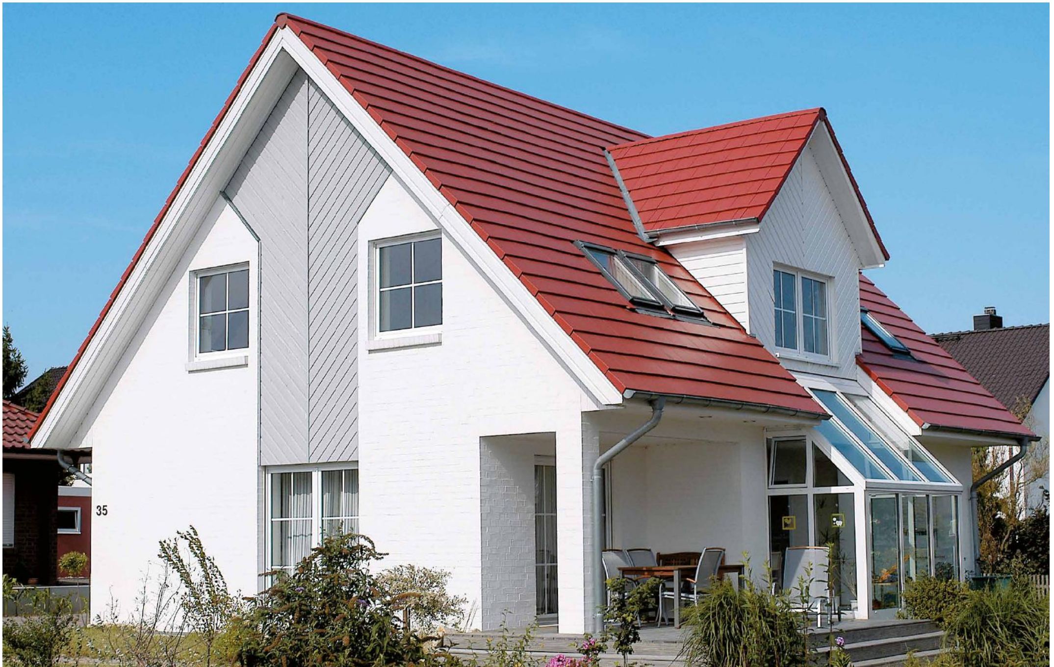
Abbildung enthält Sonderausstattungen